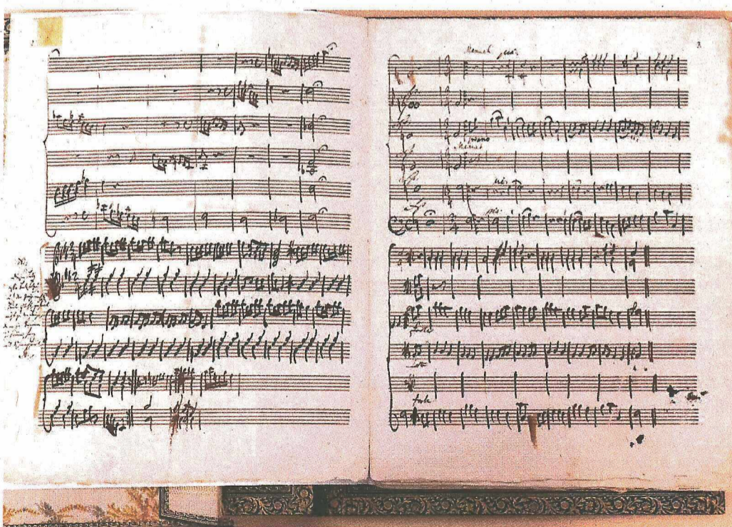
De 10-jarige Mozart voerde zijn Galimathias Musicum in 1766 in Den Haag uit.