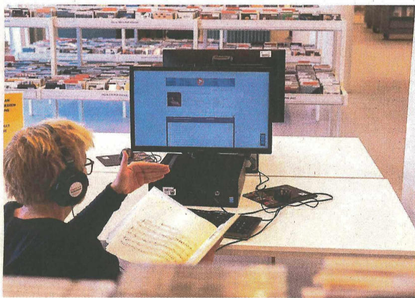
Studeren. beeld Dirk Hol